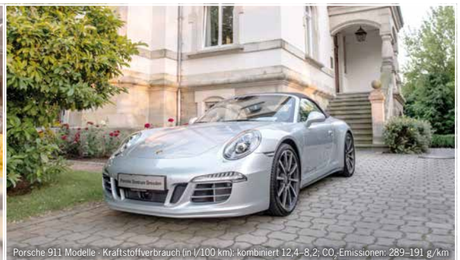
Porsche 911 Modelle - Kraftstoffverbrauch (in l/100 km): kombiniert 12,4-8,2; CO 2 -Emissionen: 289-191 g/km