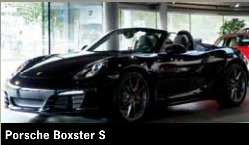
Porsche Boxster S

Ihr Porsche Cabriolet oder Roadster wartet auf Sie. Und worauf warten Sie? Öffnen Sie das Verdeck und genießen Sie das Gefühl der Freiheit. So wird schon die Fahrt ins Büro zum Kurzurlaub! Erfahren Sie Licht, Luft, Gerüche und Geräusche in ganz neuen Dimensionen. Lassen Sie sich vom einzigartigen Freiluft-Vergnügen anstecken und genießen Sie den Sommer in vollen Zügen. Wir wünschen gute Fahrt.