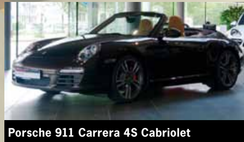
Porsche 911 Carrera 4S Cabriolet

Basaltschwarzmetallic, Lederausstattung schwarz, 232 kW/315 PS, Automatik, 20-Zoll Carrera S Rad, Sportabgasanlage, Porsche Doppelkupplungsgetriebe (PDK), BOSE® Surround Sound-System